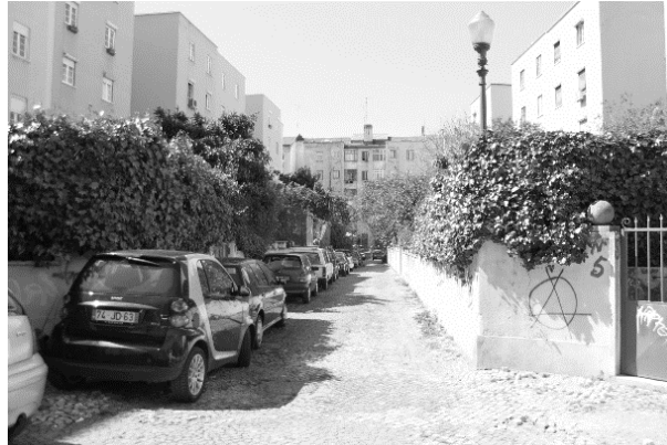
Figura 7. Vista da rua, interior do quarteirão.

do século XX, de forte vocação progressista e com políticas sociais emergentes, onde se realizam experiências urbanas em tudo semelhantes àquela que motiva este estudo. São também aqui, as necessidades de habitação e de melhorias das condições de vida de um país recentemente industrializado e comercialmente dinâmico, que originam políticas de atuação sobre o território, controlando a especulação imobiliária e propondo soluções de habitação condignas às classes desfavorecidas. Elaboram-se planos para a expansão de Amsterdão em larga escala onde se utilizam o modelo anglo-saxónico da Cidade-Jardim e o da cidade tradicional de geometria regular com quarteirões (Lamas, 1992, p. 323). A emergência das teorias sobre a cidade moderna e a aplicação extensiva do tipo ‘quarteirão’ associada à tendência política para a ‘desprivatização’ do espaço urbano privado, desencadeiam a experimentação continuada e sistemática da abertura do interior do quarteirão à cidade.