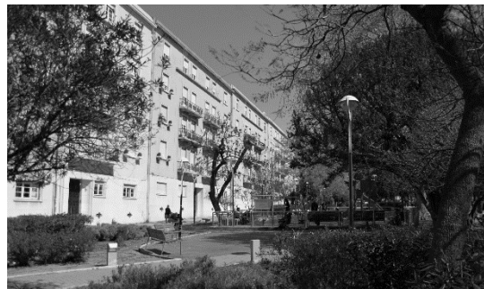
Figura 2. Vista sul, faixa ajardinada.

Trata-se de um quarteirão concebido para uso habitacional com rés-do-chão e quatro pisos.