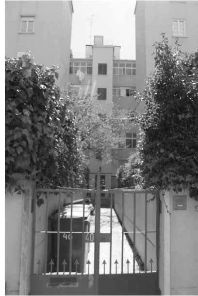
Figura 3. Pormenor do acesso aos edifícios pelo interior do quarteirão – recorte reentrante da caixa de escadas.

Tipologicamente, a maioria dos edifícios, os que preenchem os maiores lados do quarteirão, apresentam uma implantação em ‘U’ com um espaço reentrante ao eixo das traseiras, como um saguão aberto, ou um pátio que dá acesso à escada de serviço (figuras 3 e 4). Quando juntos, estes edifícios aparentam um característico ‘rabo de bacalhau’, apesar de na realidade não o serem. A designação ‘rabo de bacalhau’ é frequentemente utilizada para identificar edifícios de habitação multifamiliar cuja planta do piso-tipo tem a configuração de um ‘T’. Trata-se de uma solução ‘recorrente na arquitectura para habitação multifamiliar das décadas de 1940 e 1950. Mecanismo de projecto que permite contornar a dificuldade em fazer aprovar edifícios com grande profundidade de construção (...) mediante o desenho, em lotes de média e grande dimensão, de generosos salientes posteriores como extensão da parte central da planta. A forma resultante de planta em T, recordando o formato do gadídeo, implica o aumento significativo da área dos fogos a tardoz, ocupada na maioria dos casos com áreas