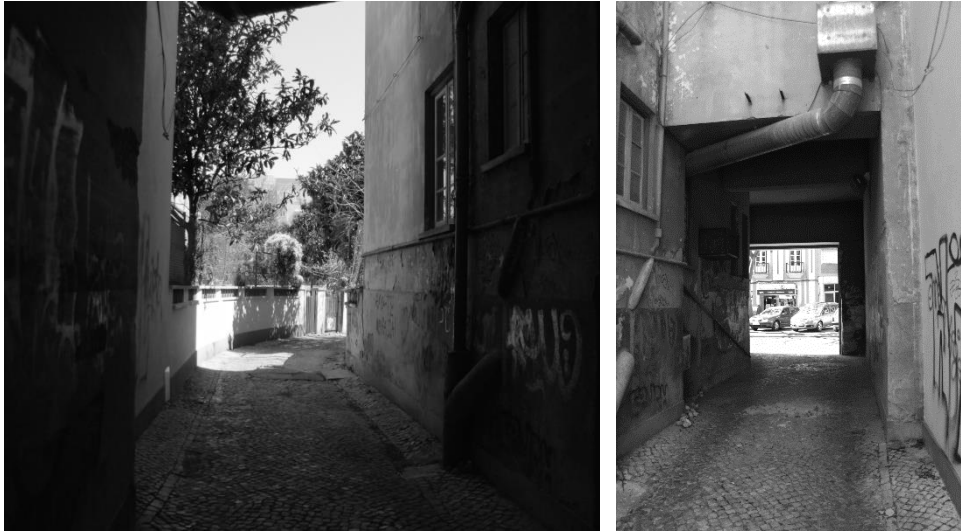
Figura 6. Túnel poente de acesso ao interior do quarteirão: a) vista para o interior, b) vista para o exterior.

lotes e mesmo quarteirões por construir.