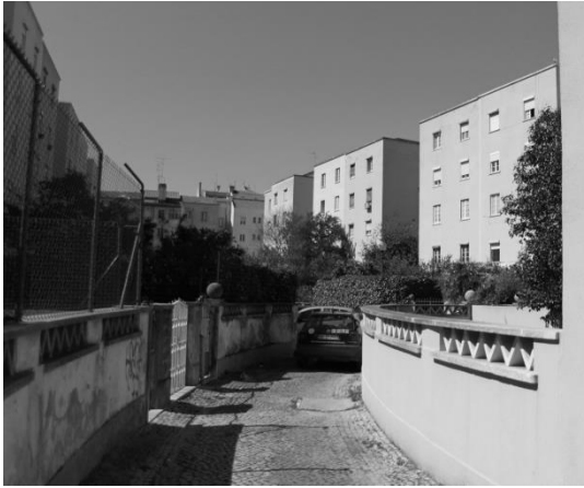
Figura 5. Acesso nascente ao interior do quarteirão.

Europa, tempos de grandes mudanças para as cidades. É neste período que se desenvolvem teorias, planos e se concretizam obras de grande dimensão que vêm a transformar profundamente as cidades, bem como, a marcar paradigmaticamente aquelas que no futuro se viriam a ampliar e a modernizar. São disso exemplo a Paris de Haussmann (1809-1891) ou a Barcelona de Cerdá (1815-1876), assim como as cidades, que mais tarde se confrontaram com a reconstrução do pós-guerra. As teorias progressistas desencadearam um movimento obstinado pela melhoria das condições de vida nas cidades, que se confrontavam com graves problemas sociais e de salubridade que resultaram do crescimento vertiginoso que algumas cidades europeias tinham tido com a Revolução Industrial.