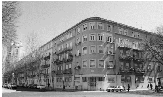
Figura 1. Vista sobre o gaveto noroeste.

O conjunto edificado em estudo, situa-se em Lisboa, nas Avenidas Novas (próximo do Bairro Social do Arco do Cego), tendo como limites: a Avenida Defensores de Chaves; a Avenida António José de Almeida; a Rua D. Filipa de Vilhena; e a Avenida Visconde Valmor (figuras 1 e 2).