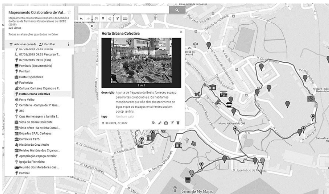
Figura 1. Exemplo de anotação (fotografia e comentário individual georreferenciado) no mapeamento colaborativo do Vale de Chelas, realizado por participantes do Módulo 1: Contextos de Urbanização e Morfologia do Curso de Especialização em Territórios Colaborativos: Processos, Projeto, Intervenção e Empreendedorismo do ISCTE, 2015.

apropriações sócio-espaciais), tornou-se produto cultural ao promover e facilitar a participação ativa da população, estimulando a interação social. Desenharam-se mapas coletivos nos quais se equacionou a análise morfológica estabelecendo indicadores sobre vivências, tendências e padrões expressos em mapeamentos dinâmicos que informaram sobre atributos espaciais, comportamentais e sensoriais. Consolidou-se a operacionalidade entre abordagens morfológicas, que possibilitou leituras desdobradas e aumentadas de espaços urbanos, contribuindo para níveis acrescentados do estudo da forma urbana – acomodando a diversidade das múltiplas dimensões equacionadas.